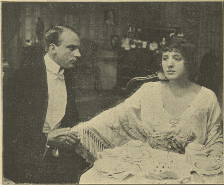
Kærlighed, der vaagner.