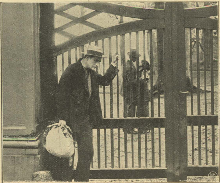
En trist Opdagelse.