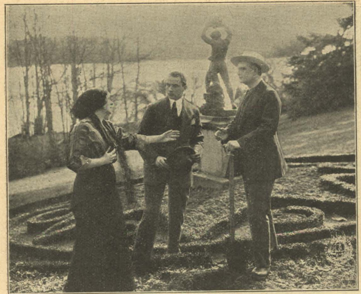
„Jeg kender Dem ikke!“

Høllegaard. Det er slet ikke hans Hensigt at volde Forstyrrelse. Han vil slet ikke forsøge at tilbageerobre Ulla. Han tænker ved sig selv, at hun vel maa være lykkelig nu, og han vil være den sidste til at ødelægge hendes Lykke. Det eneste han vil, er atter at faa Lov til at være i hendes Nærhed. Blot han maa se hende glad og fornøjet, saa er han tilfreds.