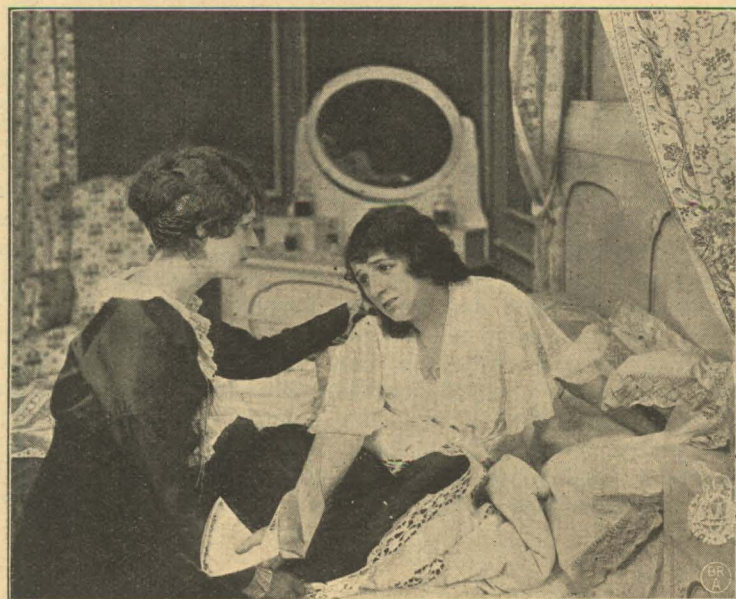
Syg af Sorg.

Ulla fandt i sin Ensomhed og Fortvivlelse Trøst hos en Veninde, Koncertsangerinden Ebba Kragh. Der gaar et halvt Aars Tid, inden Tilfældet en skønne Dag fører Ulla sammen med den unge Forfatter og Journalist, Steffen Rée, en Søn af den velhavende Godsejer Rée til Holbøllegaard. Ebba Kragh, der betragter det som en Ulykke, hvis Ulla og Egil skulde finde hinanden igen, opmuntrer den unge Mand i hans Kurmageri til Ulla, og samtidig paavirker hun tidlig og silde Veninden, hos hvem Erindringer om Manden efterhaanden er blevet trængt tilbage for den allersidste Tids nye og bevægede Indtryk. Ulla synes godt om Steffen, og hun giver tilsidst sit Minde til at lade sig skille fra Manden, der endnu sidder i Fængsel. Samme Dag Egil Holck faar sit Løsladelsesbevis, rejser Ulla med Steffen til Holbøllegaard.